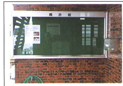
一村尾担い手センターの掲示板

また、現在の市の補助事業では、小規模な修繕や改築に補助金を使ってしまうと20年間は、補助を受けられないというシステムになっているため、この地域づくりの提案事業にシフトしている一面もあります。